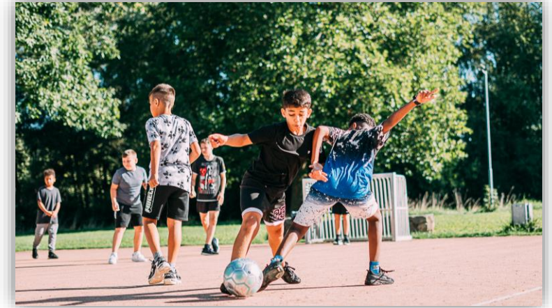
Turnen, Skateboard, Ballsportarten und vieles mehr