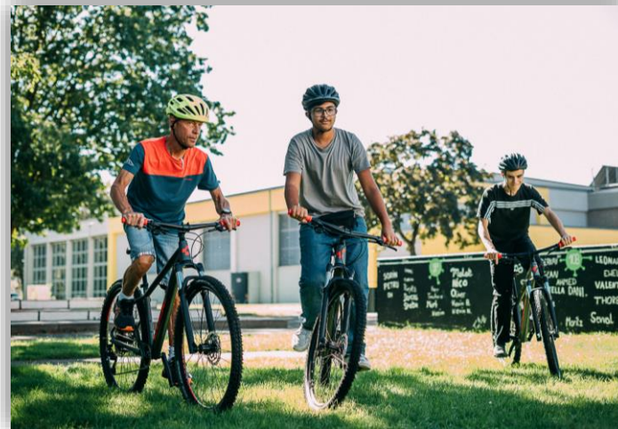
Bike-Pool und Fahrradwerkstatt